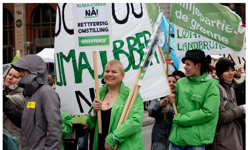
Det tradisjonelle mai-toget